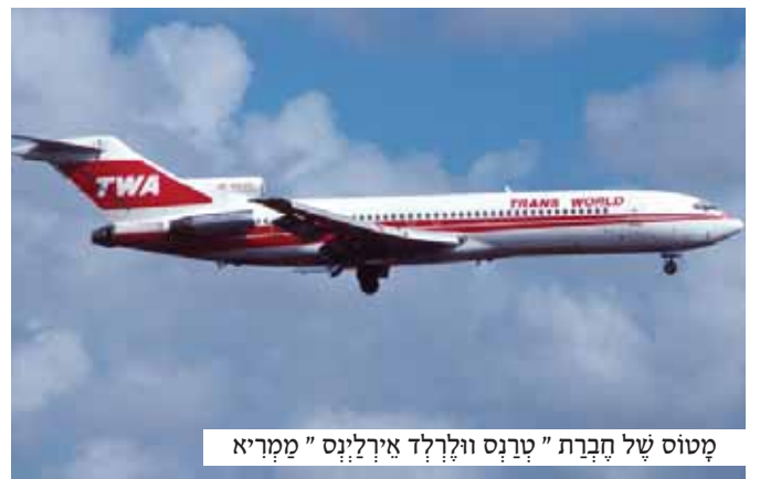
מטוס של חברת "טרנס וולרלד אירליינס" ממריא